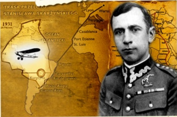
Stanisław Skarżyński pionier polskiego lotnictwa 25.770 km lotu nad Afryką