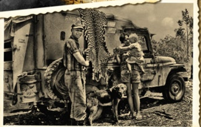
Tony Halik 20 tys kilometrów przez obie Ameryki