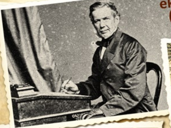
Paweł Edmund Strzelecki eksplorator kontynentu australijskiego: (Góra Kościuszki, Góra Strzeleckiego)