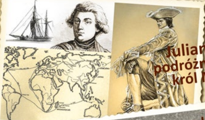
Julian Beniowski podróżnik, awanturnik, król Madagaskaru